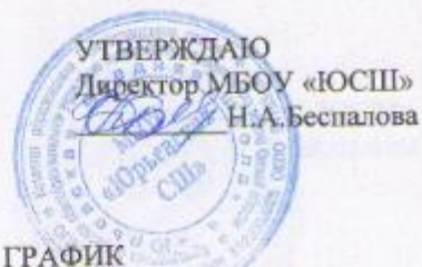
ГРАФИК проведения школьного этапа ВсОШ в 2016/2017 учебном году

Приложение №1 к приказу МБОУ «Юрьевская СШ» № 170 от 16.09.2016