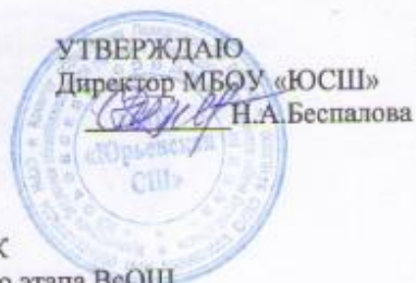
ГРАФИК проведения школьного этапа ВеОШ в 2016/2017 учебном году